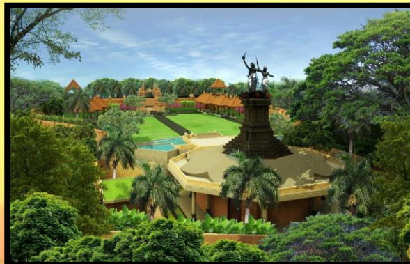
Gambar Perspektif 2