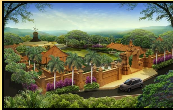
Gambar Perspektif 1